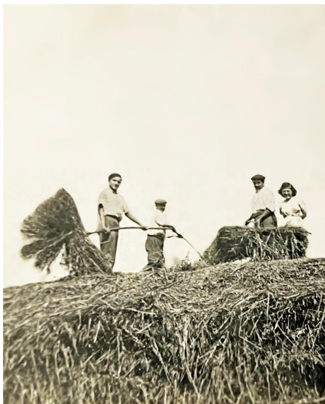
Avant la mécanisation...

« L'agriculture a beaucoup évolué, c'est incroyable : Quand j'étais gamin j'attachais les bottes avec de la paille de seigle mise bout à bout, puis ça a été des cordes. Maintenant les batteuses connaissent tout, le rendement, l'humidité du blé, etc. La vente des bovins a aussi évolué. Avant, pour vendre des bovins, on traitait avec des maquignons, maintenant on traite directement avec la Socopa qui fait 50% de la viande de France. »