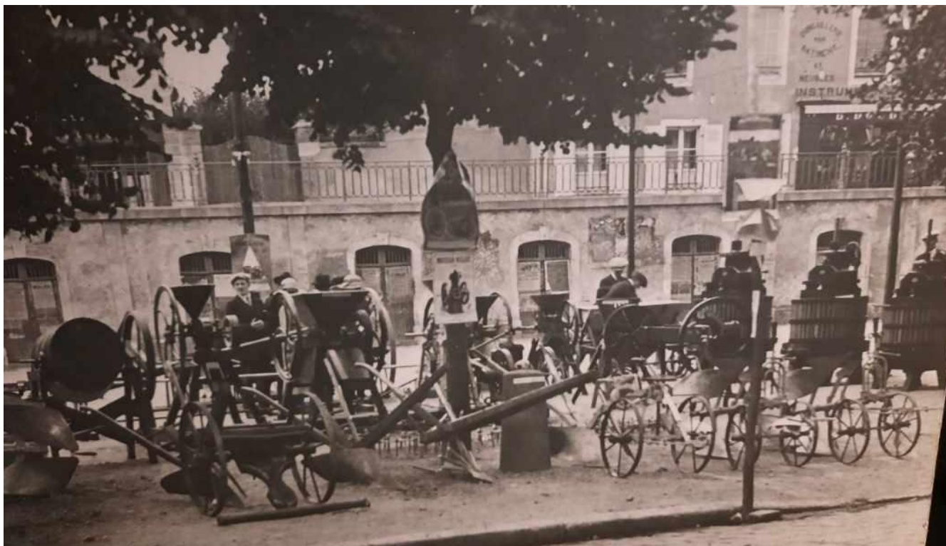
Présentation de matériels de la société Maurice Grouas lors d'une foire à Bonnétale