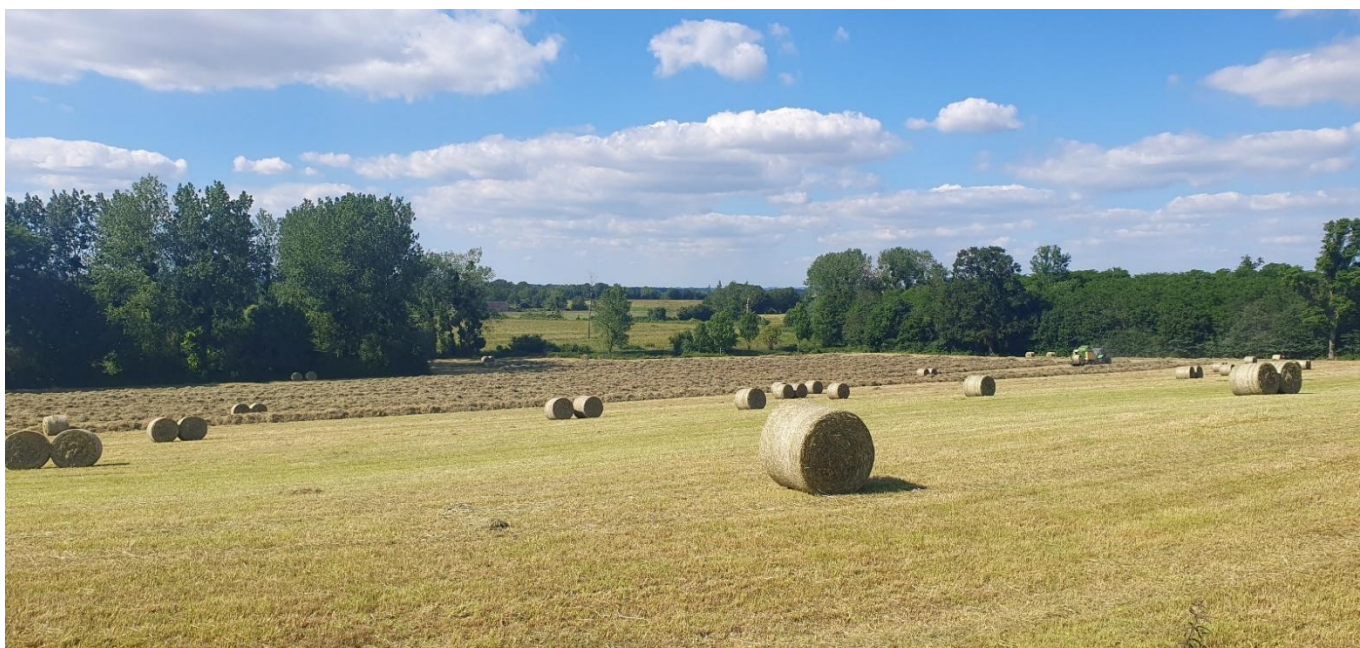
Champs à Courcival