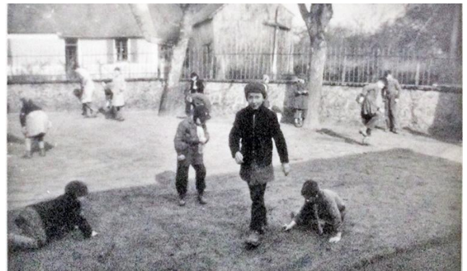
Jeux de billes et palet pendant la récréation