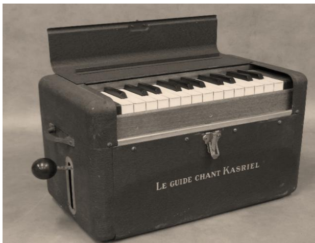
Guide Chant Kasriel

On chantait aussi chaque matin. On piochait dans le catalogue des « chants du certificat ». La Marseillaise, le Chant du départ ou des chants du folklore. On s'aidait avec le « Guide Chant », une sorte de petit harmonium que l'on remontait à la main tout en jouant. C'était assez pratique. Il avait un clavier transposable, qui permettait de changer d'octave facilement, par exemple pour chanter moins haut.