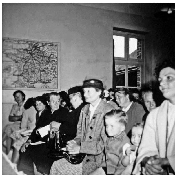
A la remise des prix

Un employé municipal avait monté une petite scène à l'intérieur de la classe. On y présentait des scénettes, on avait préparé des chants, des danses inspirées du folklore. Je me souviens du quadrille des lanciers. Quel succès !