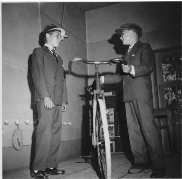
« Le cycliste est sans pitié ». G. Billon et S. Bernard, 1958

En juillet la fête de l'école était aussi le jour de la distribution des prix qui se faisait en présence du maire, des conseillers municipaux et des parents. Chaque élève avait un prix offert par la municipalité : prix d'excellence, 1 er prix, prix d'histoire, de sciences, récitation, calcul mental etc.