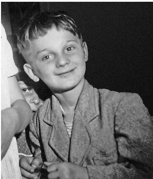
Des jours heureux

Il y avait un électrophone avec des disques de musique classique qu'on écoutait régulièrement. Deux fois par semaine, grâce au poste que mes parents m'avaient offert, nous écoutions la radio scolaire et des émissions de musique. Enfin il y avait le « Guide Chant », cette sorte de petit harmonium qui accompagnait nos chants.