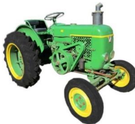
201 SF VIERZON

Le premier tracteur des Pivard était un 201 SF VIERZON. Les écoliers l'admiraient, et les adultes aussi !