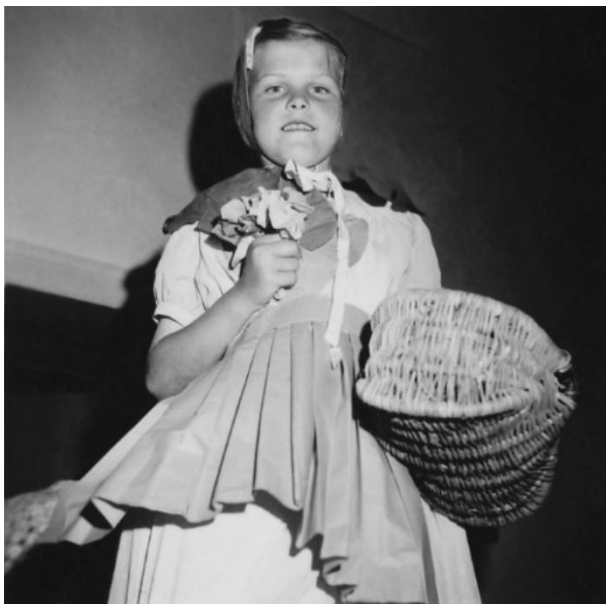
Le petit chaperon rouge

L'autre événement important était le passage du certificat, mais on n'y présentait qu'un petit nombre. La plupart des élèves finissaient leurs études à 14 ans, en sachant lire, écrire et compter. Ils ont eu des cours de français, de mathématiques, d'histoire, de géographie, de couture, de dessin. Et il y avait la sacro-sainte dictée : 5 fautes et vous étiez éliminé !